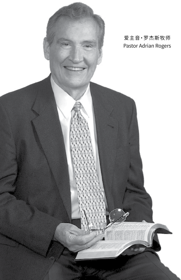
爱主音·罗杰斯牧师 Pastor Adrian Rogers